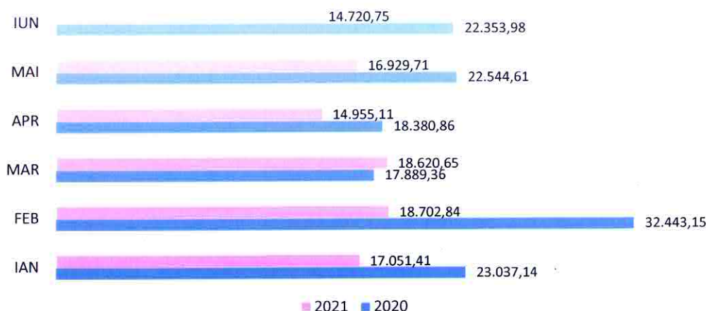
Fig. 2-1 Distribuția lunară a cantității de mărfuri manipulate