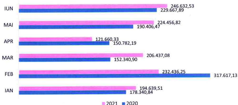
Fig. 2-2 Distribuția lunară a valorii serviciilor de mărfuri manipulate

Societatea a realizat în semestrul I din exercițiul financiar 2021 și venituri din alte servicii portuare (chirii spații, depozitare, energie electrică, servicii portuare) în valoare totală de 216.004,09 lei , după cum este prezentat comparativ în Fig. 2-3 prin raportare la aceeași perioadă din anul precedent 2020.